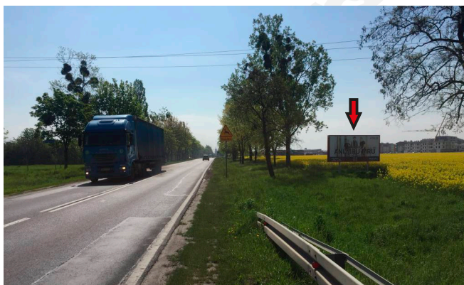
NUMER TABLICY – 90A